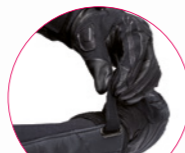
ZAPIĘCIE MANKIETU SP CUFF

KOLOR: CZARNY NR KATALOGOWY: 1667556/ROZMIAR/101L CENA: 1049 ZŁ ROZMIARY: 36-46