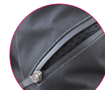
WŁOT WNĘTYLACYJNY ZAPINANY WODOODPORNYM ZAMKIEM