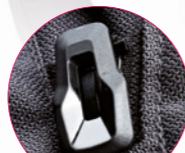
ZATRZASK SUWAKA CLICK PULLER