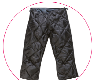
PODPINKA DO SPODNI LUNA STAR I LUNA STAR HP

Ciepła podpinka dedykowana do spodni LUNA STAR i LUNA STAR HP.